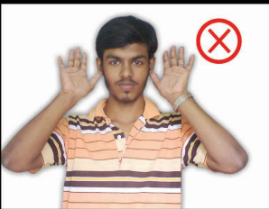
காதுகளை தொடுவது தவறு