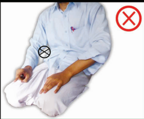
கடைசி அத்தனறியாத்தில் இருக்கும் போது தவறான செயல்